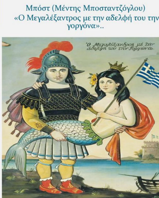
Μπόστ (Μέντης Μποσταντζόγλου) «Ο Μεγαλέξαντρος με την αδελφή του την γοργόνα»...