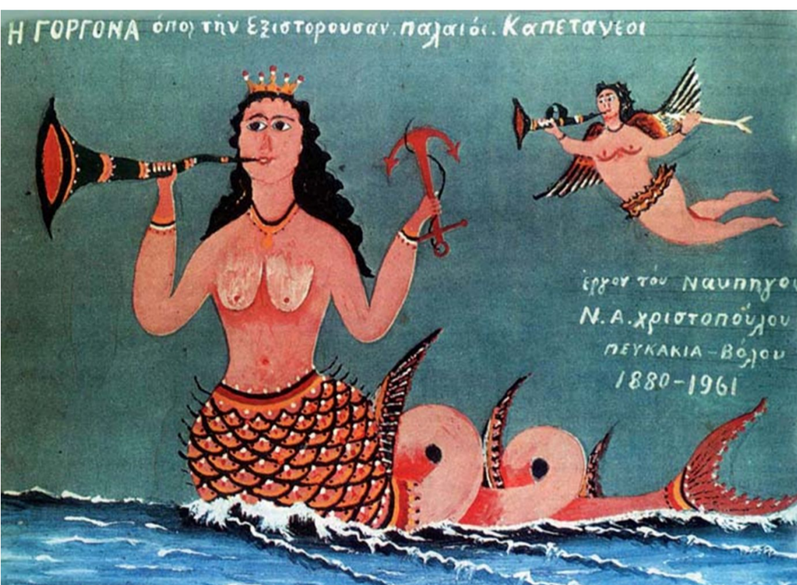
Η ΓΟΡΓΟΝΑ οποι την Εξιστορουσαν Παισιόι. Καπετάνιοι

Εργα του Ναυπηγού Ν. Α. Χριστοπούλου ΠΕΥΚΑΚΙΑ - ΒΟΥΛΑ 1880 - 1961